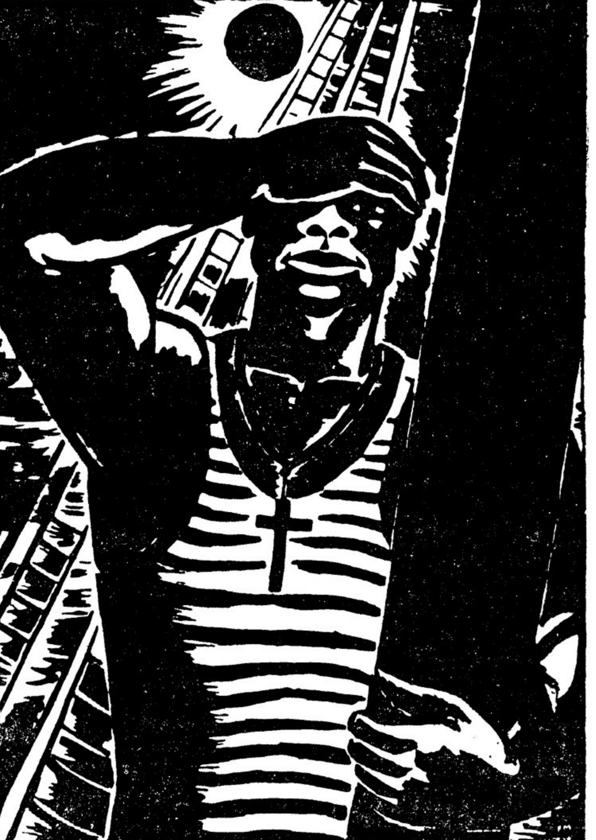
Ф. МАЗЕРЕЕЛЬ. «У мачты». Гравюра на дереве. (Из гравюр, привезенных художником для организуемой ВОКС выставки его работ в Москве).

От детского садовника до помещика клуба агрономской школы-десятилетия примерно километр ходьбы. Мы увидели прекрасные крепкие здания, хорошо одетых колхозников, садики, на которых развивались ребята-школьники. Признаться, я ни раз овладевал некоторой болезнью по поводу нашего выступления. Лекция по истории музыки без каких-либо артистических аттракционов не всегда может привлечь полный зал даже в Москве. Каково же было наше удивление, когда мы увидели переполненную аудиторию в клубе и в вале большую группу колхозников, приехавших издалека. Войти в довольно обширный зал клуба оказалось делом довольно сложным для посетителей. Колхозный хор сел и выразительно и чисто несколько массовых так перед своим выступлением, как на этот раз. Было немалое страшно, что совершат прямо перед собой большие плакаты с точным перечислением моих работ по музыке. Это очень обидливо. Я решил не описывать содержания и кратко начал излагать основные проблемы истории музыки — развитие массовой песни и отдельных музыкальных жанров (опера, симфония, камерной музыки). Подобрать и организовать на развитие советской музыки. Выслушав на час, Овациями, что говорю уже 1 1/2 часа, а из зала все еще не слышно слы-