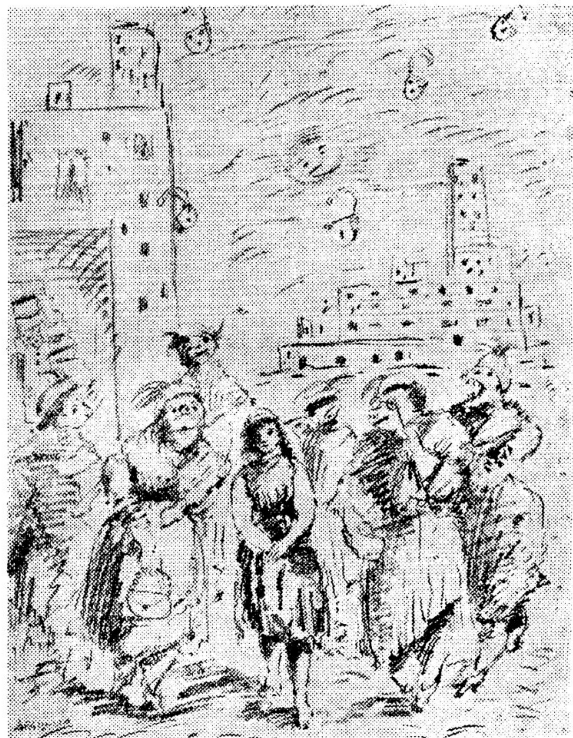
А. ТЫШЛЕР. Рисунок к «Золушке» С. КИРСАНОВА.

аунами. Только кое у кого первомайские значки или красивые гвоздики в петличках. Шли молча, угромо, точно это был похороны, а не торжественная встреча пролетарского праздника. «Демократическая» полиция потребовала, чтобы демонстрация происходила на окраине, чтобы во время шествия не было никаких знамен, ни песен, ни возгласов, ни речей. И на все эти униженные требования полиция согласилась вождя II Интернационала! С тяжелым чувством стыда и обиды мы возвращались с этого униженного зрелища... Нет, уж лучше борьба с полицейскими бадами, с казачьими валами, чем эта тулая покорность и смиренность!