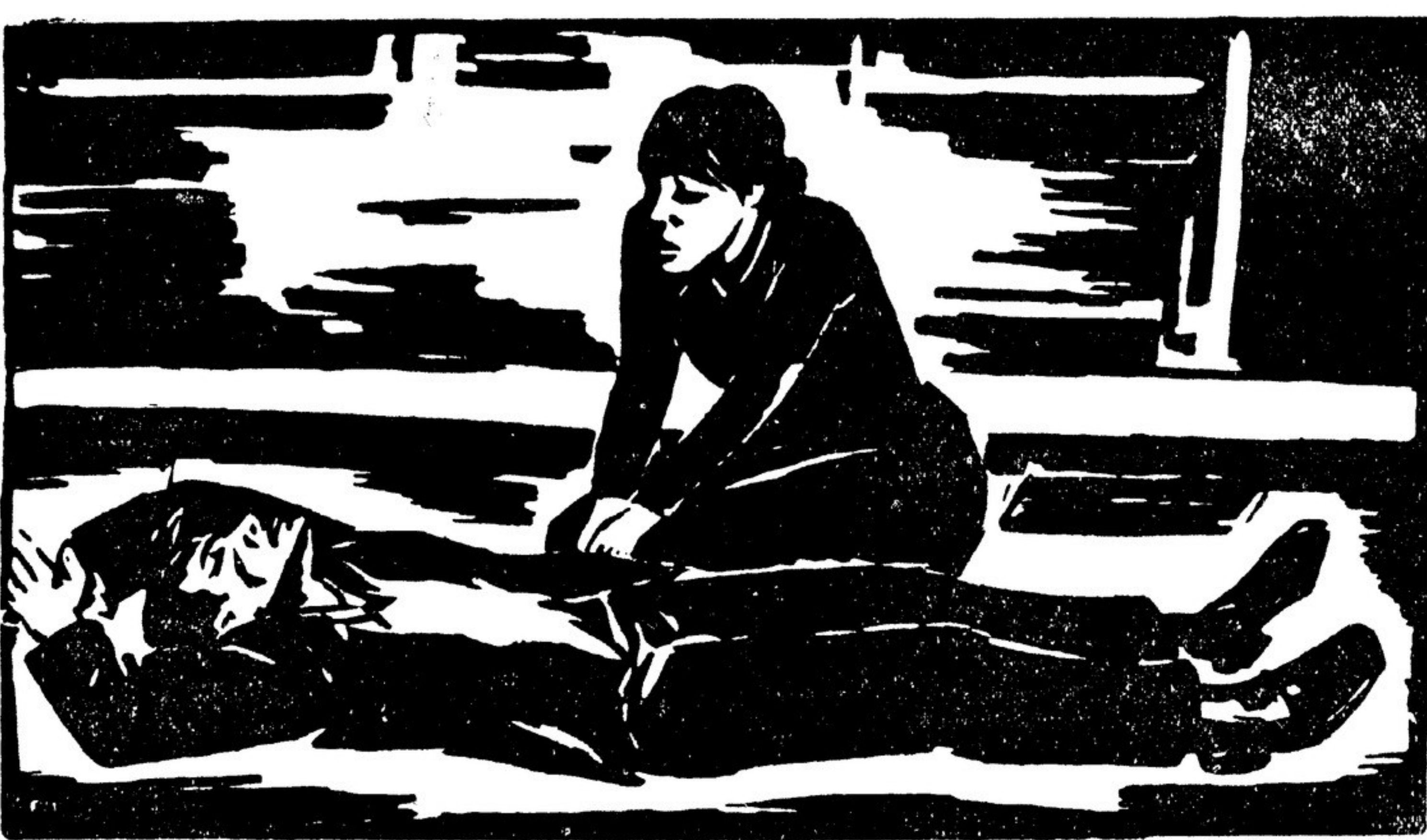
Ф. МАЗЕРЕЕЛЬ. «Смерть». Гравюра на дереве. (Из гравюр, привезенных художником для организующей ВОКС выставки его работ в Москве).