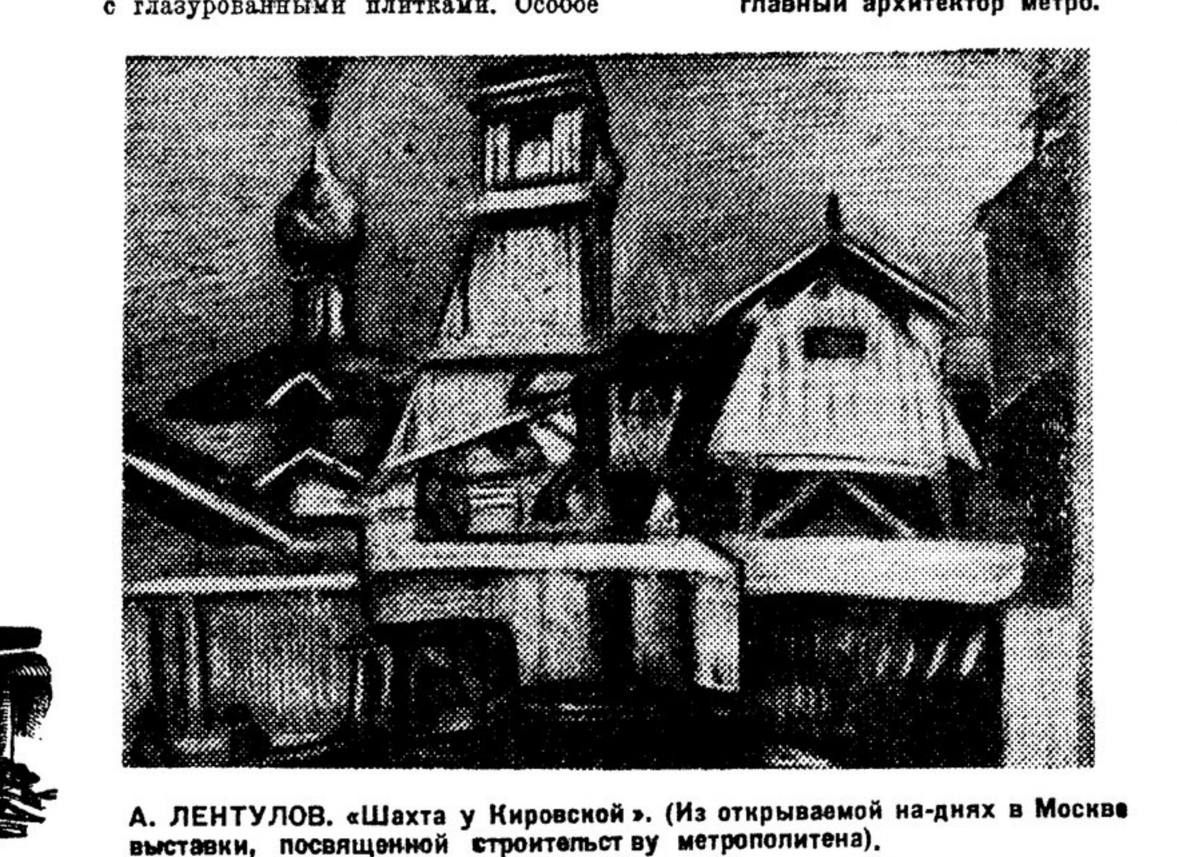
А. ЛЕНТУЛОВ. «Шахта у Кировской». (Из отрываемой на-днях в Москве выставки, посвященной строительству метрополитена).

Непосредственное, повседневно руководившее лично Лазаря Моисеевича удержало все эти разрозненные творческие усилия огромного коллектива архитекторов от неминуемого разброда и обеспечило всей архитектуре метро внутреннее единство и некий цельный стиль. С. М. КРАВЕЦ главный архитектор метро.